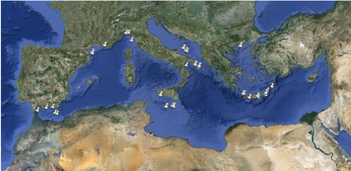
Figura 2: Ubicación de algunas poblaciones de estructuras de invertebrados en el Mediterráneo. Estos son, principalmente, "corales de aguas profundas" (según los autores del Documento y & [8], [9], [10]).

De este modo, su presencia puede ser una precondition necesaria para el establecimiento de medidas específicas. A pesar de que en la actualidad no están siendo muy considerados en lo que respecta a la conservación, ya que únicamente el arrecife de Santa Maria di Leuca, con Lophelia y Madrepora ha sido incluido desde 2006 como zona restringida para la pesca por la CGPM [11], se encuentran en el origen de la creación de AMP (por ejemplo, los cañones de Cassidaigne y Lacaze-Duthiers, Francia). De manera similar, Italia ha elegido dos sitios a tal efecto (los taludes continentales del archipiélago Toscano y del sector de Santa Maria di Leuca) para el establecimiento de una red Natura 2000 en el mar, y muchas se incluyen en la propuesta para establecer una AMP representativa en el mar de Alborán [6].