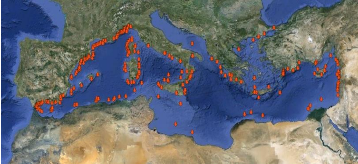
Figura 1: Distribución de los principales cañones identificados en el Mediterráneo (según los autores del Documento y [3], [6]).