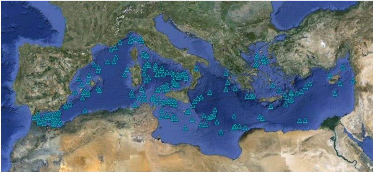
Figura 4: Distribución de los principales montes marinos en el Mediterráneo

(Figura 4), con más de 127 de ellos a nivel del mar Tirrénico y el estrecho entre Sicilia y Túnez.