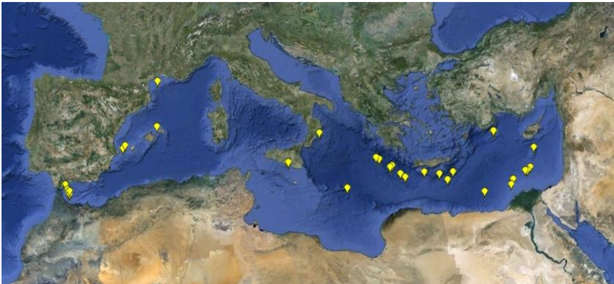
Figura 3: Ubicación de las poblaciones quimiosintéticas que han sido estudiadas en el Mediterráneo (según los autores del Documento y [6], [12], [13], [14], [15]).

Los rezumaderos fríos parecen encontrarse bien representados a lo largo del pliegue Mediterráneo (cuenta oriental; Figura 3). Los diapiros de lodo son frecuentes en la cuenta oriental, especialmente a nivel del pliegue Mediterráneo y en el sudeste de la cuenca, pero el descubrimiento de alvéolos alrededor de las islas Baleares nos permite suponer su existencia en la cuenca occidental (Acosta et ál. , 2001, en Figura 3). Por último, se han localizado seis lagos anóxicos hipersalinos a nivel del pliegue Mediterráneo [4] (Figura 3).